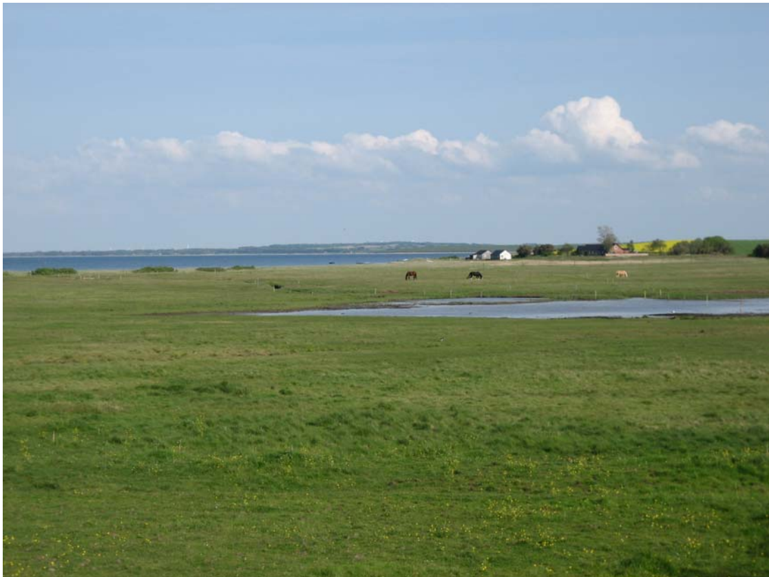
Græsset strandeng på Jegindø.

Endelig udføres en særlig indsats for truede naturtyper ved at sikre og udvide arealerne med rigkær, surt overdrev og kalkoverdrev, samt for den truede plante gul stenbræk ved at udvide arealet med egnet levested. For de truede ynglefugle alm. ryle, brushane, splitterne, dværgterne og mosehornugle samt den sjældne hvidbrystet præstekrave sikres levestederne en kvalitet og størrelse, så de kan understøtte et tilstrækkeligt antal ynglepar.