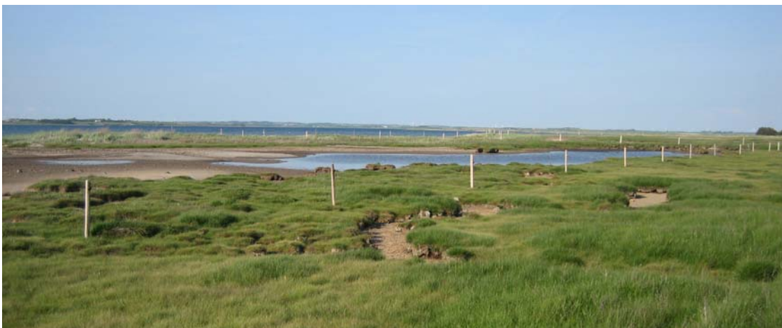
Velplejede strandenge ved Munkholm.

Der anvendes mange forskellige bekæmpelsesmetoder over for de invasive arter. For flere arter og metoder, kendes der i dag ikke en effekt, men blot en vurdering på baggrund af kortvarige og uvidenskabelige undersøgelser. Bekæmpelsen af de invasive arter skal derfor udføres med varsomhed, da det ved forkert bekæmpelse kan risikeres, at bestanden vil forøges frem for at mindskes (f.eks. slåning af rynket rose en gang om året, medfører et forøget antal rodskud).