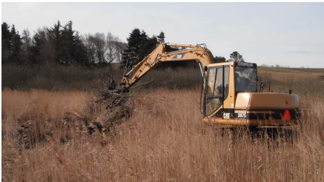
Naturpleje i form af oprykning af piletræer i rigkær.

For de øvrige arter på udpegningsgrundlaget er der i den statslige Natura 2000-plan lagt op til anvendelsen af de virkemidler, som fremgår af tabel 2.